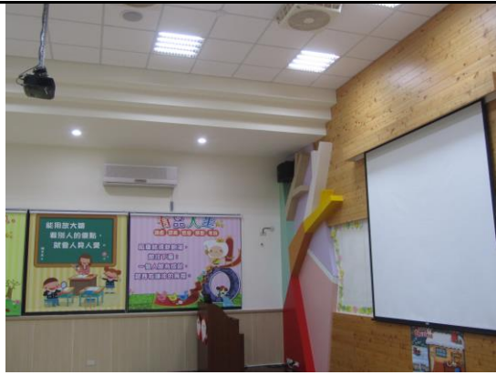
活動中心投影設備